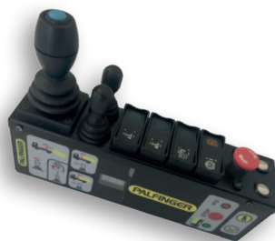
Pro Active Drive